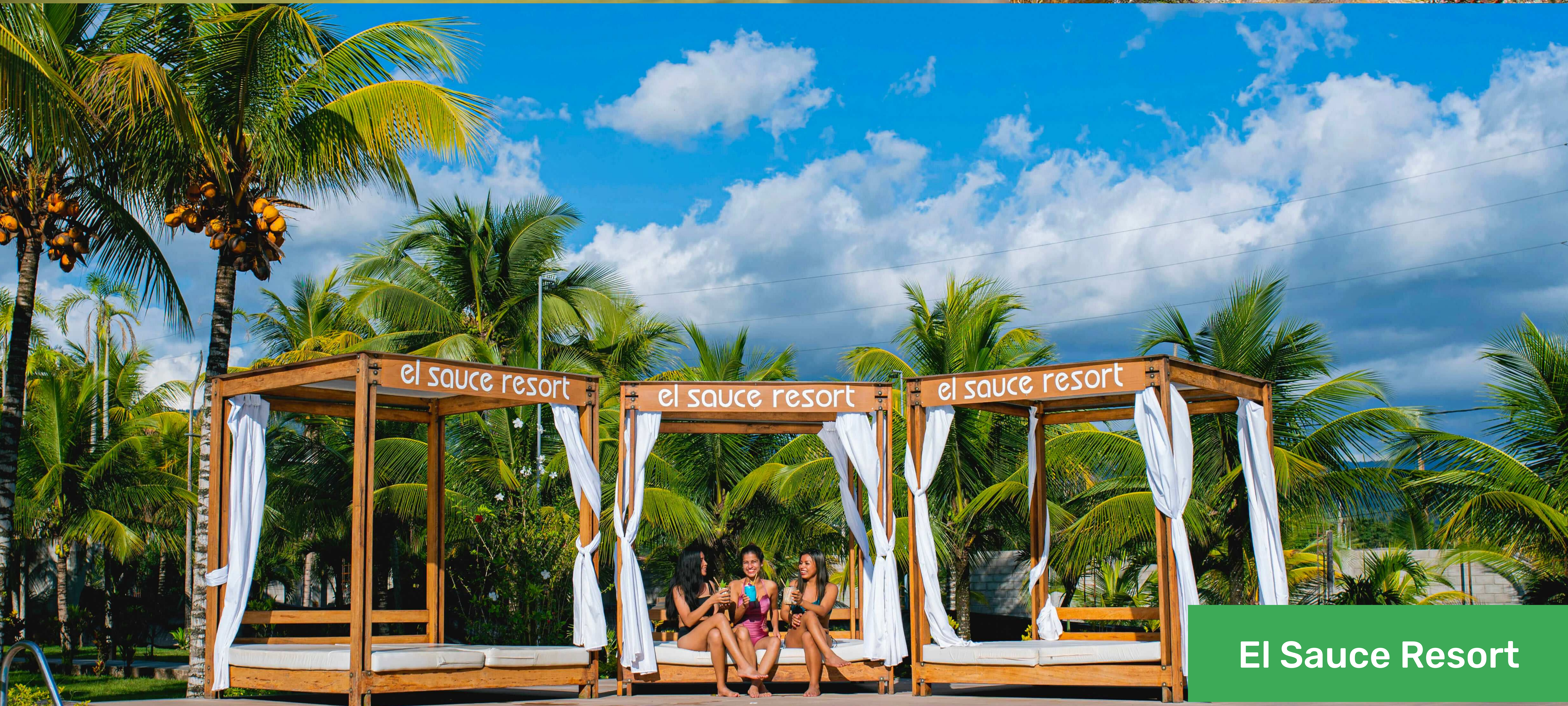
El Sauce Resort